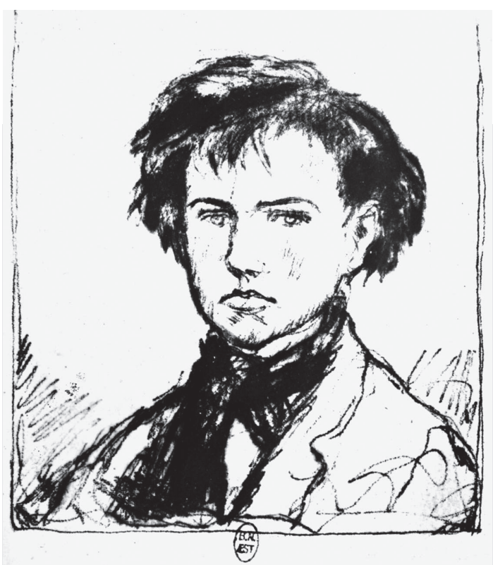
Desenho por Coussins (século XIX)