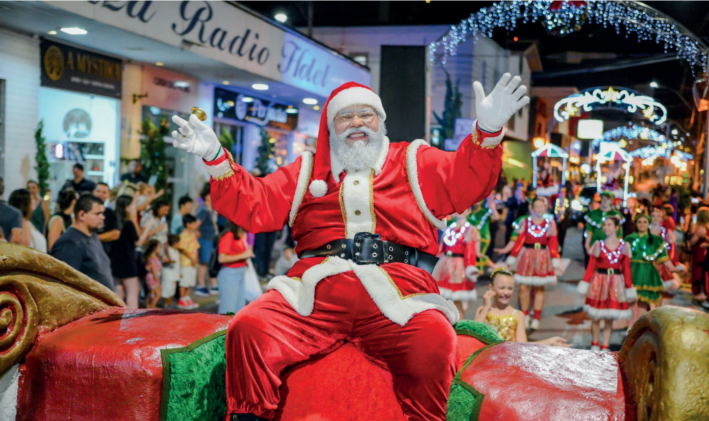
Tradicional cortejo natalino em Serra Negra conta com a presença do Papai Noel e centenas de artistas locais

Quase dois milhões de luzes irão iluminar a cidade, com apresentações artísticas e Paradas de Natal até o final de dezembro