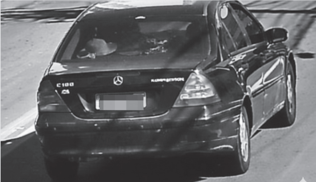
Região do Circuito das Águas Paulista tem dia de operações bem-sucedidas contra o crime, com destaque para uso de tecnologia e eficiência policial

Ambos foram conduzidos ao Distrito Policial de Águas de Lindóia, onde foram autuados por tráfico de drogas, posse ilegal de arma de fogo e captura de procurado.