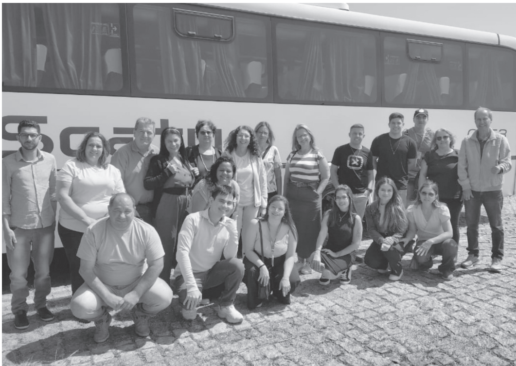
Encontro entre empreendedores de todo o país aconteceu no São Paulo Expo

Evento ocorreu em São Paulo na semana passada e atraiu milhares de pessoas