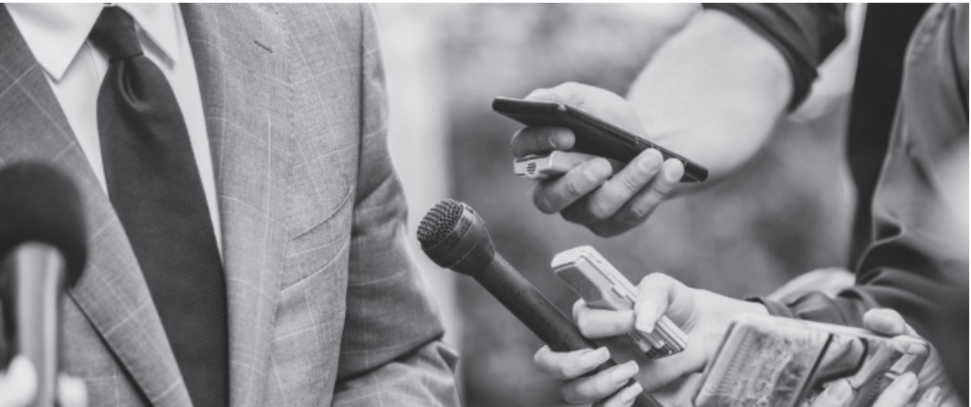
Jornalistas brasileiros são alvo de perseguições por parte de detentores do poder

Cuba, El Salvador, Nicarágua, Peru, Venezuela, entre outras nações. Estados Unidos Embora aponte para uma deterioração geral, a SIP manifestou especial preocupação com a situação nos Estados Unidos, cujo presidente, Donald Trump, e seus seguidores, investem reiteradamente contra veículos de imprensa e jornalistas que criticam a atual gestão. “Temos observado, com alarme, uma crescente deterioração do clima de trabalho dos profissionais de imprensa nos EUA, historicamente considerados um farol para as liberdades democráticas”, comentou Dutriz, referindo-se a episódios recentes. No início do mês, dezenas de jornalistas das principais agências e veículos de notícia, incluindo a FOX News, devolveram suas credenciais de