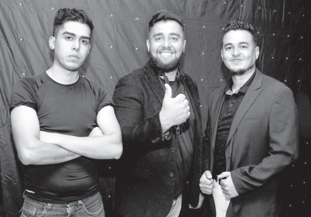
Show beneficente acontece no Clube 1º de Outubro

com uma noite animada, com repertório variado e momentos de descontração”, comenta. Ela aproveita para fazer o convite a todos os moradores da cidade e visitantes da região: “Além de curtir boa música, todos teremos a oportunidade de contribuir com uma causa social importante de nosso município, fortalecendo o espírito de união e solidariedade da comunidade monte-alegrense e de todo o Circuito das Águas”.