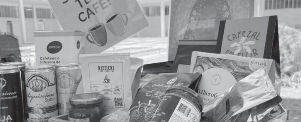
Festival será realizado de 7 a 9 de novembro no Oscar Plaza Shopping

Evento tem entrada gratuita e programação sensorial dedicada à valorização do café regional