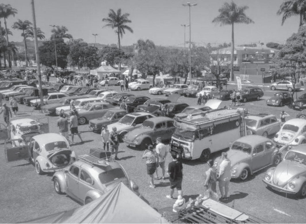
Evento gratuito reúne milhares de pessoas no Centro Cultural de Jaguariúna

Programação inclui carreata, shows sertanejos e orquestra de violeiros no Centro Cultural