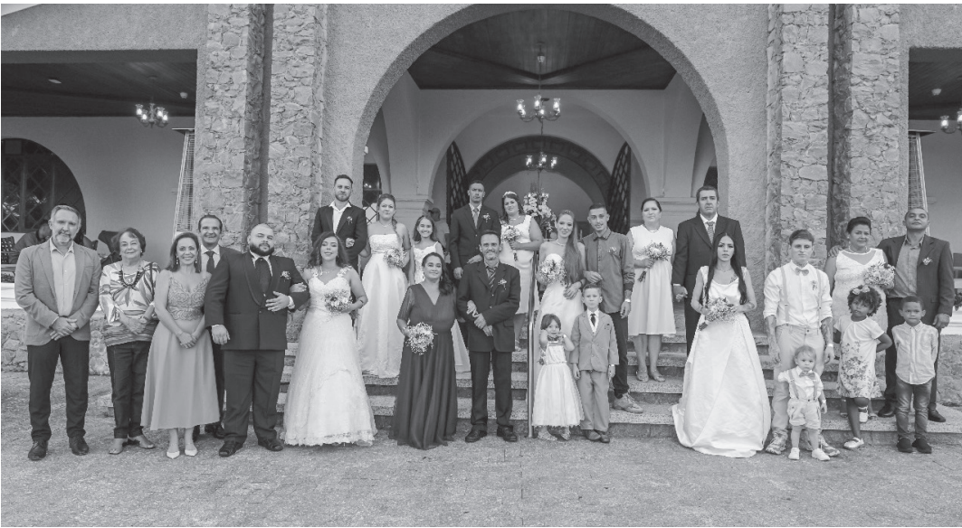
A próxima edição do casamento Comunitário em Serra Negra será realizada no próximo ano | Prefeitura de Serra Negra

A regularização da situação matrimonial é um direito de todo brasileiro, e é fundamental para o estabelecimento de direitos e deveres dos parceiros diante do ordenamento jurídico.