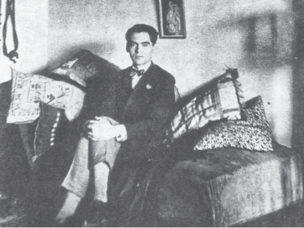
Federico García Lorca (1898–1936), poeta e dramaturgo espanhol

Lorca nos lembra que a poesia não é fuga: é enfrentamento. Que a beleza pode ser uma forma de resistência. E que o verdadeiro poeta não morre – apenas muda de corpo, de voz, de século.