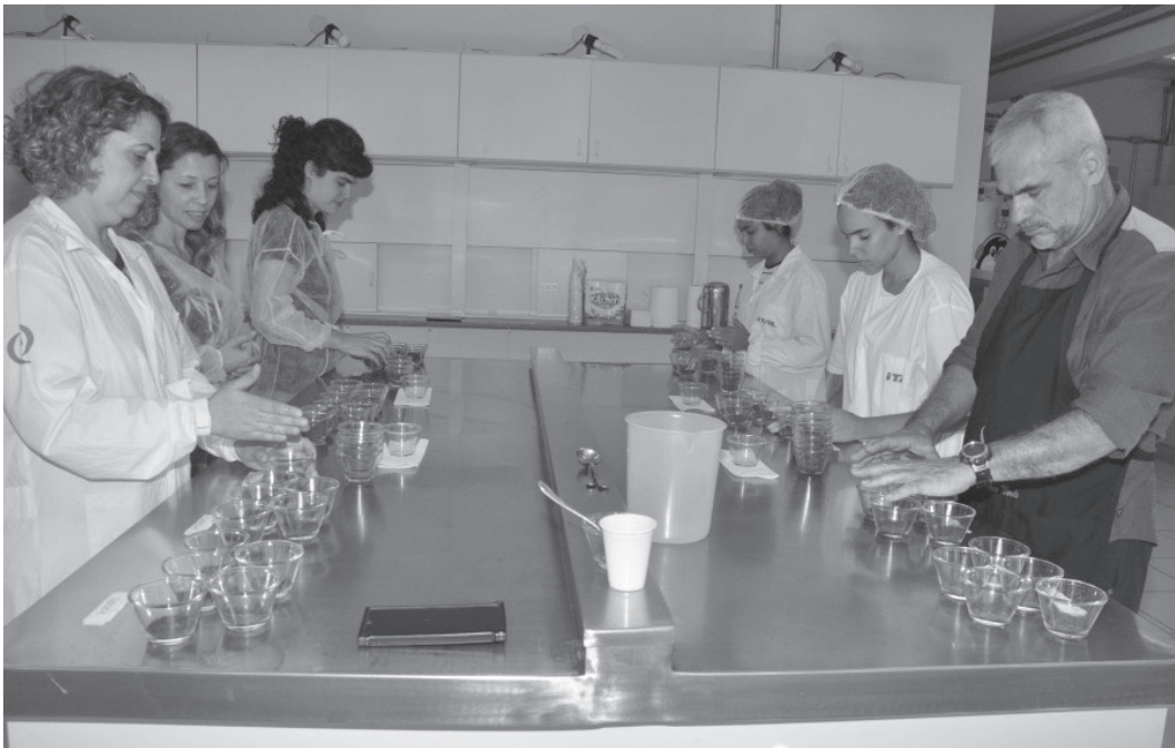
Mais de 300 cafeicultores de 77 municípios paulistas participaram da primeira etapa do concurso

Edição de 2025 conta com 390 cafés inscritos e avaliação técnica em Campinas; premiação será em novembro