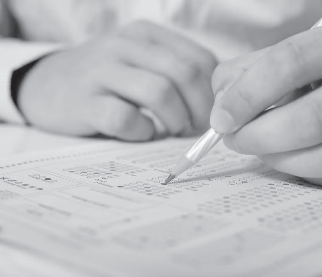
Inscrições seguem até o dia 4 de novembro