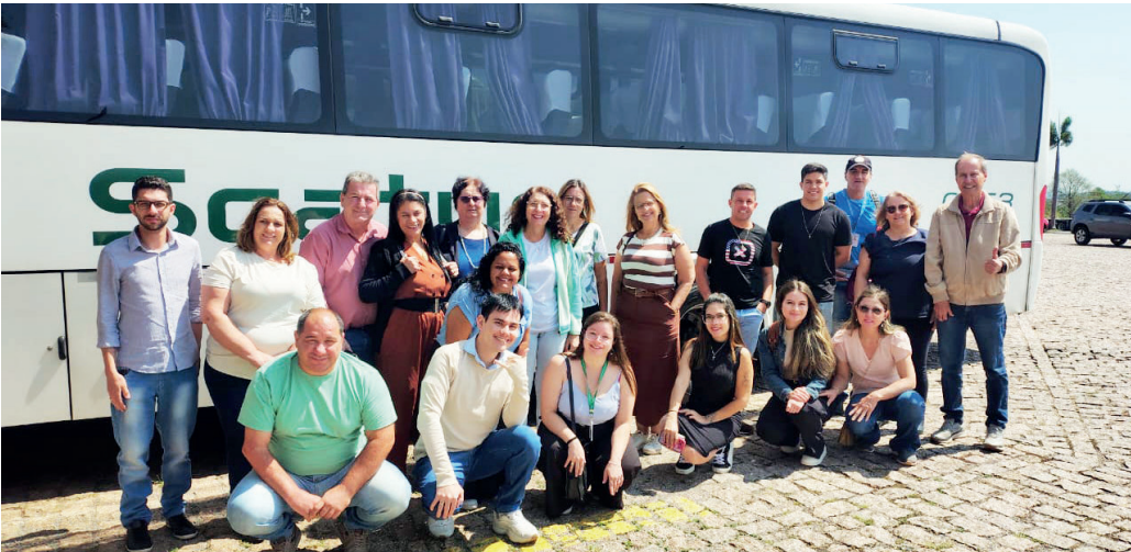
Empresários de Serra Negra participam de evento sobre empreendedorismo, em São Paulo | Prefeitura de Serra Negra

Grupo de 20 empreendedores participou de palestras, capacitações e networking em evento que reúne tendências e soluções para negócios