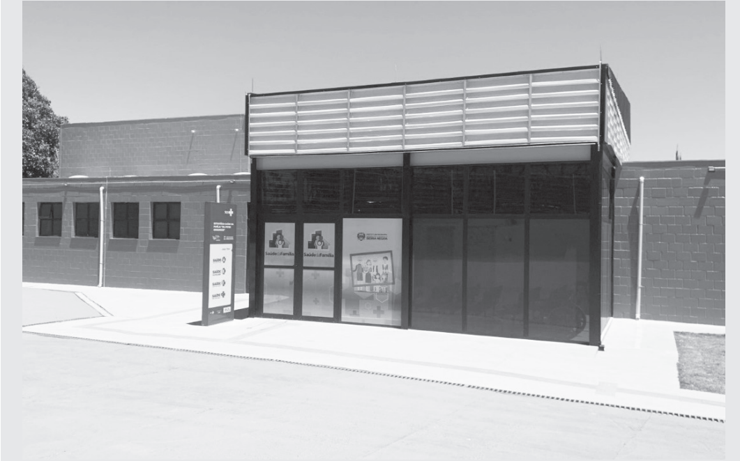
Novo espaço conta com amplas salas de atendimento e apoio

Inauguração acontece na manhã deste sábado, 25