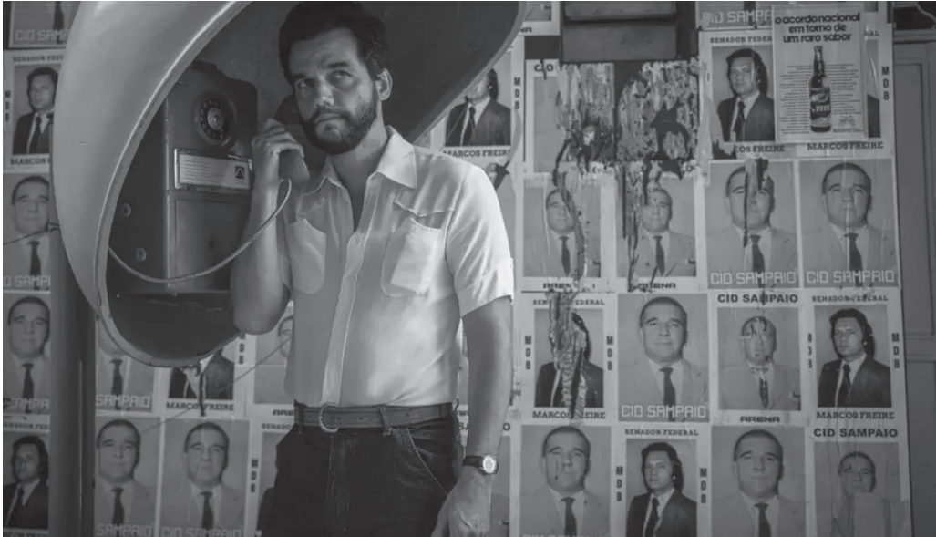
Longa-metragem que traz Wagner Moura como protagonista pode ser o representante brasileiro na premiação do próximo ano

Após vencer a estatueta inédita com “Ainda Estou Aqui”, Brasil corre em busca de mais um prêmio da Academia