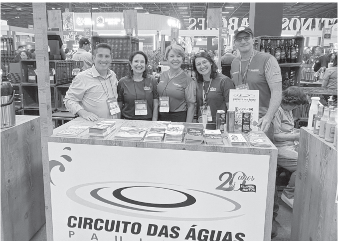
Membros do CICAP representam os nove municípios do Circuito das Águas Paulista na Feira do Empreendedor 2025, destacando o turismo e os negócios da região