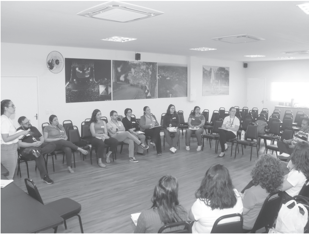
Profissionais da saúde mental durante o 1º Ciclo Formativo do projeto “Nós na Rede” no Centro Administrativo de Serra Negra | Prefeitura de Serra Negra

Iniciativa do Ministério da Saúde e Fiocruz capacita profissionais da Rede de Atenção Psicossocial para fortalecer o cuidado humanizado em saúde mental