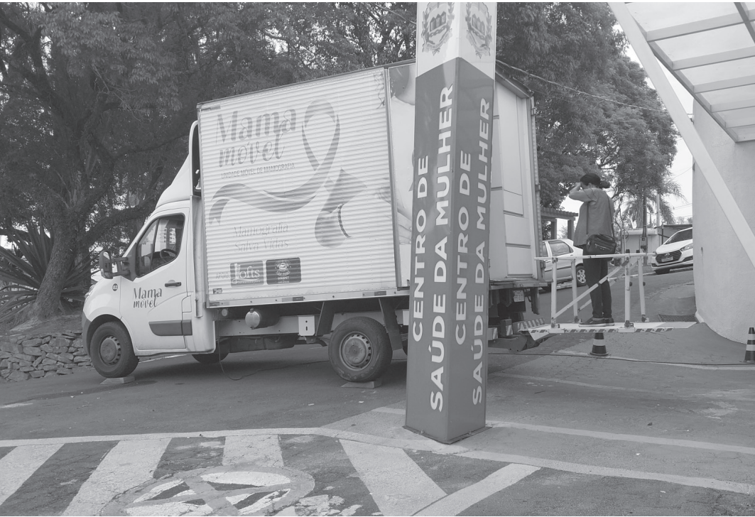
Carreta de mamografia esteve no município coletando cerca de 350 exames neste mês

Unidades de saúde do município mantêm horário estendido para coleta de exames de papanicolau