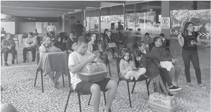
Centenas de tutores enviaram seus Pets para castração na semana passada | Prefeitura de Serra Negra

são visíveis: há notável redução no número de animais abandonados, contribuindo para uma cidade com menor risco de zoonoses e melhor qualidade de vida para toda a população”.