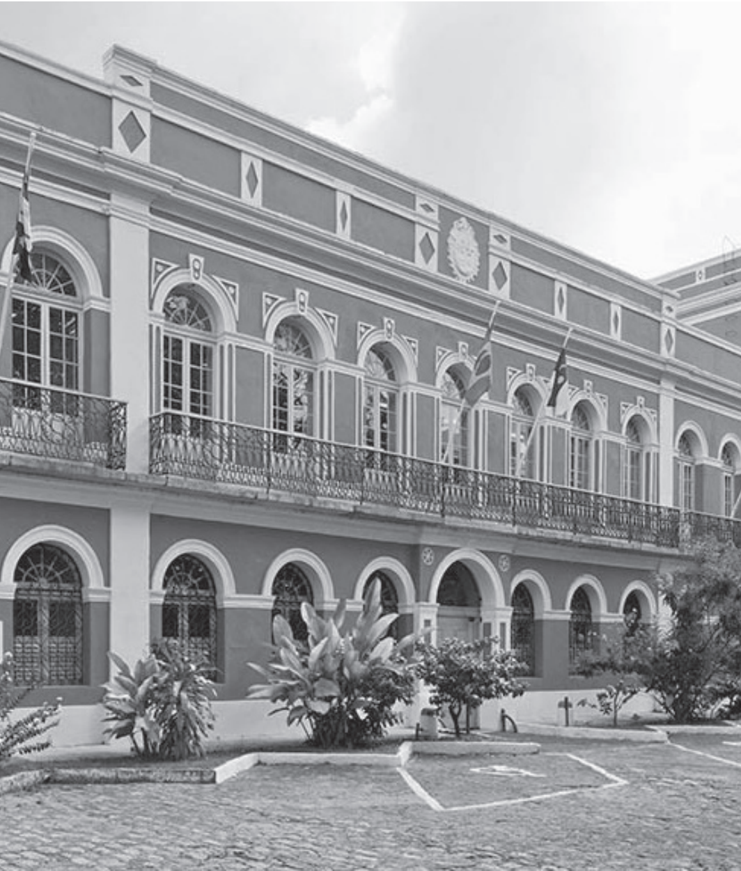
Usuário tem acesso a arquivos em fotos, vídeos, documentos e publicações