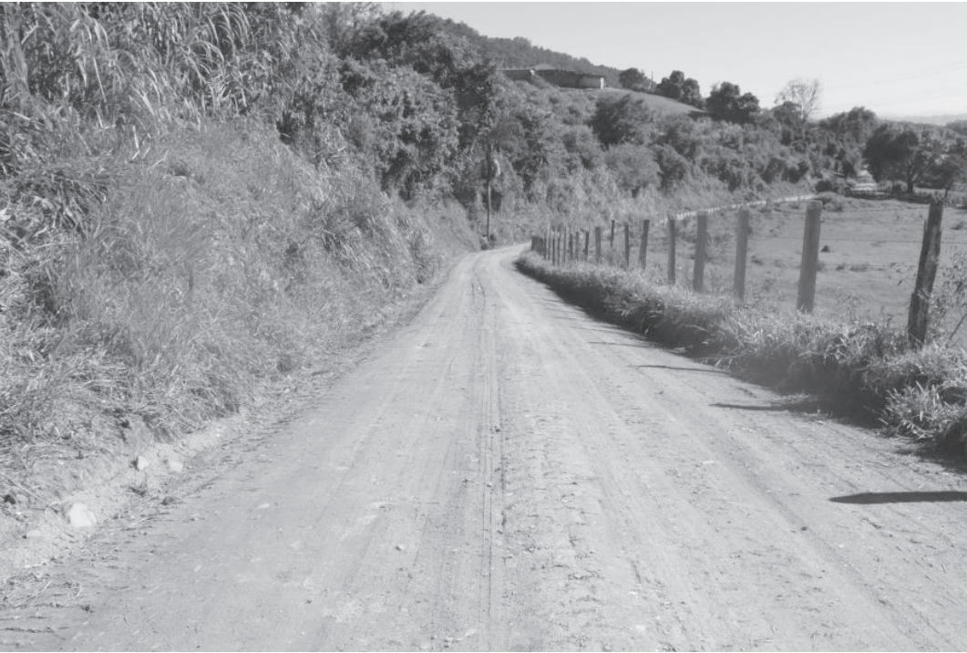
SISGER contribui no planejamento de demandas de execuções em estradas rurais | Prefeitura de Serra Negra

Programas visam fortalecer área rural e zonas de interesse turístico do município