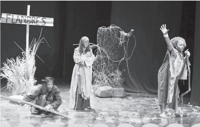
Cia. Epidários de Teatro de Franco da Rocha-SP apresenta o espetáculo “A Parábola dos Cegos”