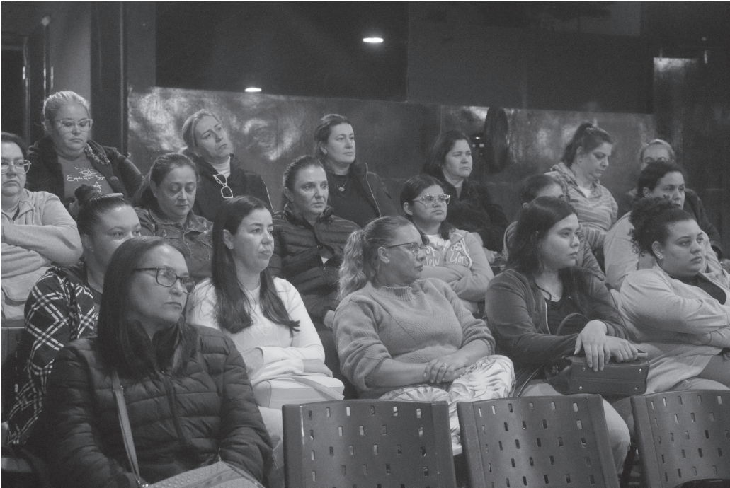
Escola de Governo atuou junto a servidores públicos da área da Educação | Prefeitura de Serra Negra

Ação da Prefeitura de Serra Negra compreende diversos setores do município