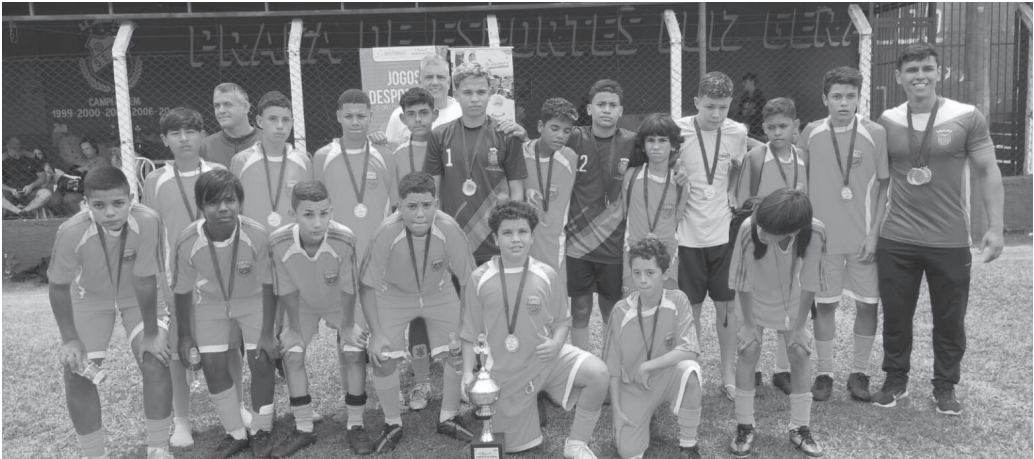
Jogos Desportivos do Circuito das Águas Paulista 2025 deixam legado de integração, amizade e superação para toda a região

Jaguariúna sagrou-se campeã geral dos Jogos, com destaque no vôlei, futsal, basquete e futebol