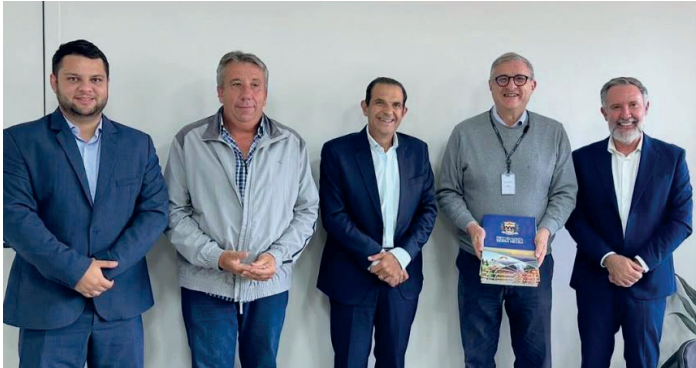
Representantes de Serra Negra durante reunião na Secretaria Estadual, em São Paulo

Reunião em São Paulo discutiu melhorias para estradas vicinais e serviços públicos no município