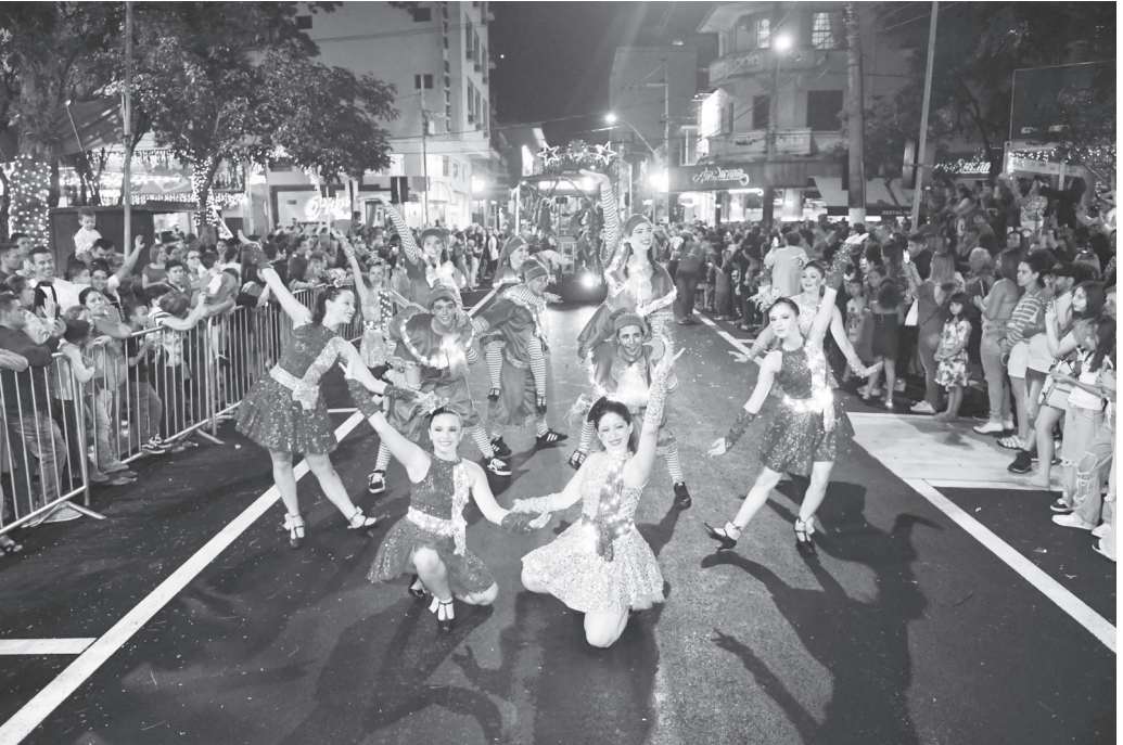
No coração de serranos e turistas, a Parada de Natal é o principal evento da programação de fim de ano em Serra Negra

Cerimônia de abertura contará com coral do Projeto Guri e quase dois milhões de luzes que iluminarão Serra Negra até o fim de dezembro