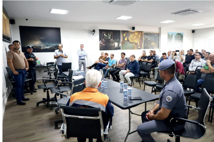
Prefeitura e órgãos de segurança alinham ações preventivas após aviso de chuvas intensas | Prefeitura de Serra Negra

Reunião emergencial uniu Prefeitura, Defesa Civil e setor privado para reforçar as ações de segurança