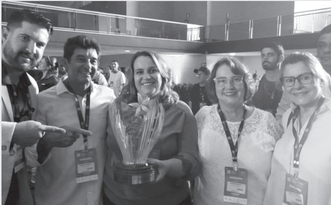
Representantes do Café Nonno Marchi e de produtores do Circuito das Águas recebem prêmio em Belo Horizonte durante a SIC

O reconhecimento de marcas locais fortalece o cenário cafeeiro em Serra Negra, e leva o nome da cidade para todo o país, dando força