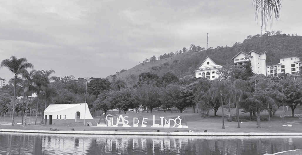
Aniversário de Águas de Lindóia tem programação musical, feira de café e chegada do Papai Noel

Todos os eventos são gratuitos e abertos ao público