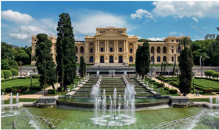
Museu do Ipiranga cria podcast com a missão de mostrar o papel da instituição para além das exposições

O Museu do Ipiranga, em São Paulo, lançou o primeiro episódio do podcast “Pensar o presente – histórias de um museu em transformação”, como parte das comemorações pelos 130 anos de abertura da instituição. Produzido pelo Estúdio Novoel, o projeto reflete, com olhar crítico, as narrativas do museu ao longo de sua existência.