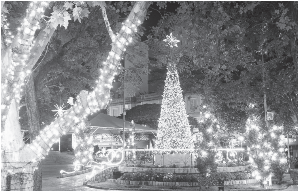
Mais de 2 milhões de lâmpadas decoram o centro e os bairros da cidade durante o período natalino

Iniciando nesta sexta-feira (14), evento gratuito movimentará o Circuito das Águas até 31 de dezembro