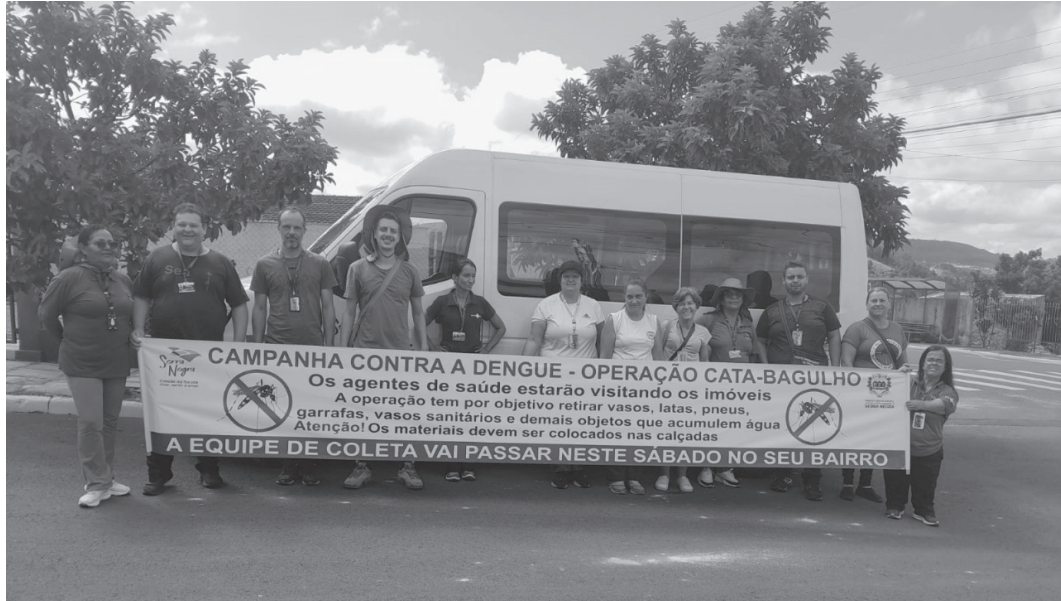
Equipes realizam inspeção em imóveis residenciais e comerciais do município | Prefeitura de Serra Negra