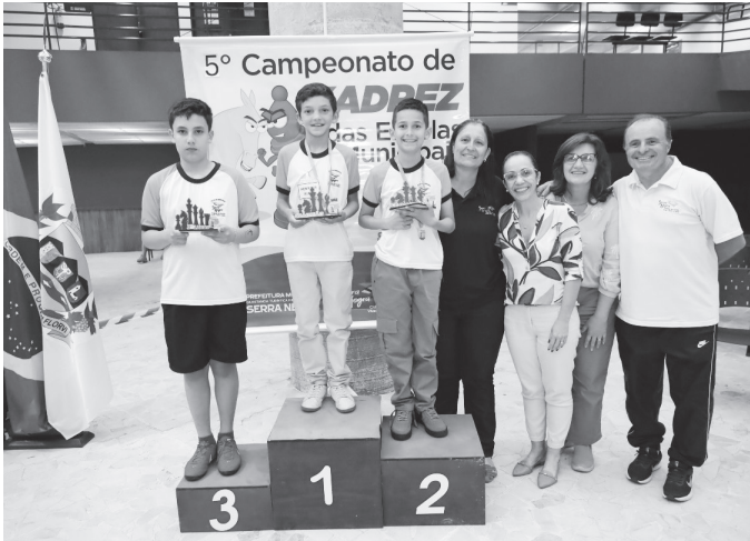
Vencedores do 5º Campeonato de Xadrez das Escolas Municipais | Prefeitura de Serra Negra