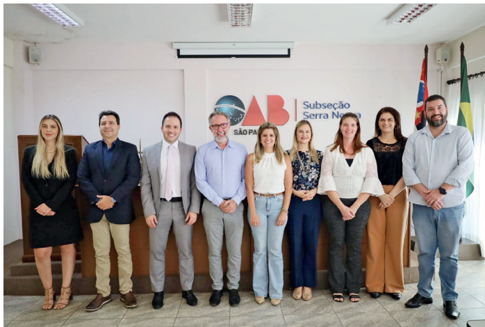
Representantes do Poder Judiciário, Executivo e sociedade civil durante a 1ª Semana de Conciliação em Serra Negra

Evento fortaleceu o diálogo, reuniu instituições e beneficiou mais de 60 pessoas com soluções rápidas