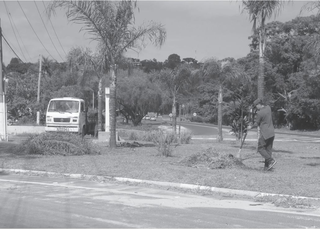
Rotatória da Rodovia Engenheiro Geraldo Mantovani (SP-360), que dá acesso ao Bairro Refúgio da Serra recebeu serviços de capinação e roçagem

zonte, onde serviços de zeladoria também foram executados. De acordo com a pasta, essas ações fazem parte do Programa Prefeitura Bairro a Bairro, que tem como objetivo “deixar Serra Negra mais bonita, bem cuidada e acolhedora para quem vive aqui e para quem vem nos visitar”.