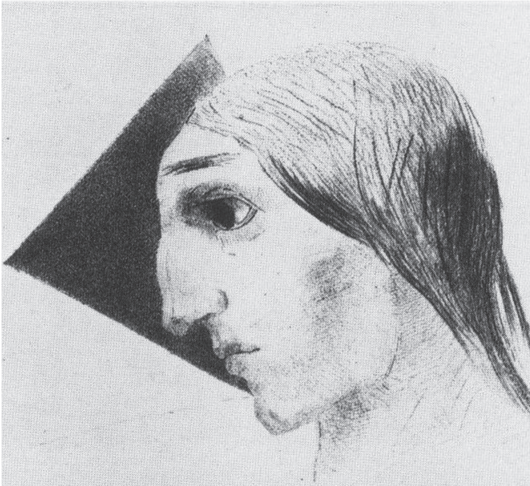
Loucura, por Odilon Redon (1882)

Um cansaço que não é do corpo, mas da alma que pede atenção – atenção verdadeira, silenciosa, inteira. Porque a existência só se