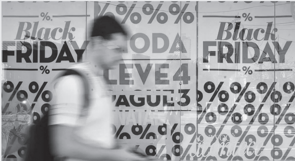
A Black Friday é um fenômeno que vai muito além dos preços

Objetivo é entender hábitos, percepções e emoções durante o período de compras e usar os resultados como base para novos estudos e ações educativas