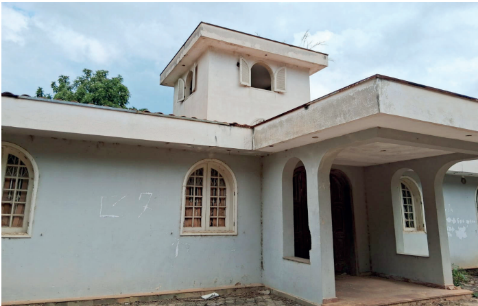
Residência no Bairro do Barroão, na Rota Turística do Alto da Serra, foi planejada por nazista que atuou em Auschwitz