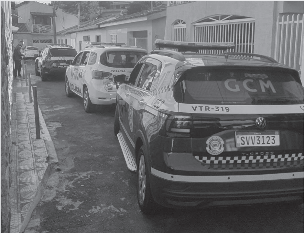
Dois mulheres e um homem, além de um menor de idade, foram encontrados na residência na Vila Quiriqui

Ação ocorreu na manhã de terça-feira (11)