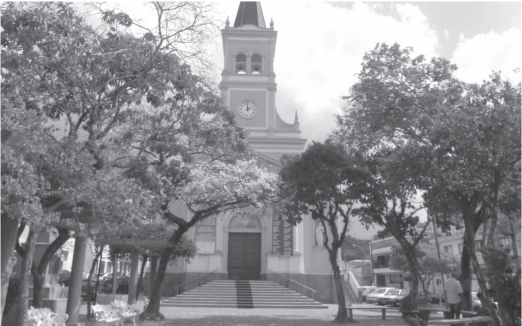
Igreja Matriz de Nossa Senhora do Rosário, ponto histórico de Serra Negra, cuja praça reformada há um ano já apresenta sinais de deterioração