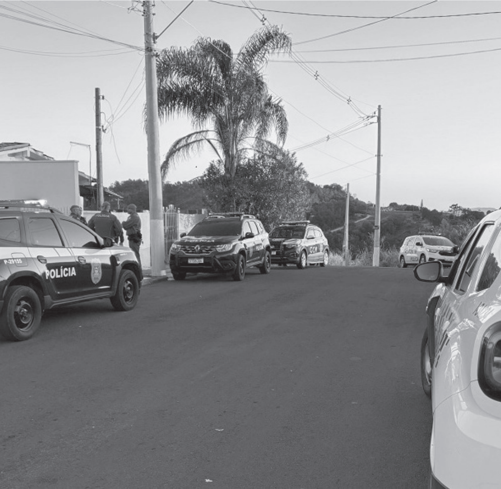
Operação levou dois suspeitos à Delegacia de Polícia local

Ação contou com apoio da Polícia Militar e da Guarda Civil Municipal