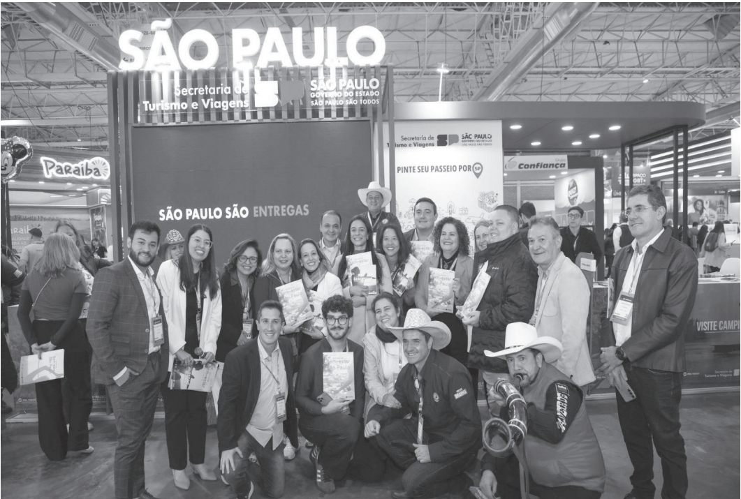
Estande da Setur-SP, durante a Festuris, em Gramado

Águas de Lindóia, Amparo e Socorro são destaques de estande do Governo de São Paulo