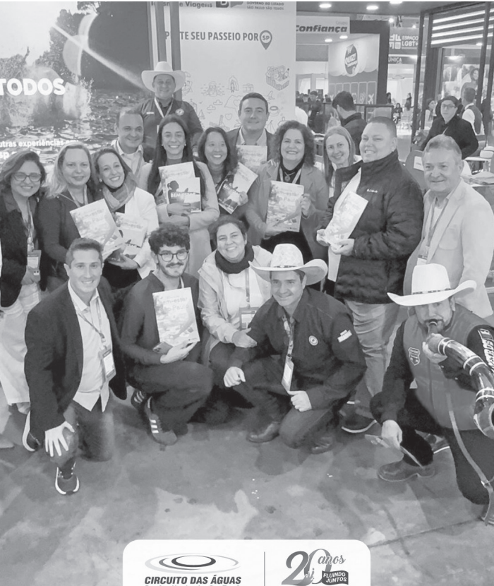
Gestores públicos e profissionais do turismo regional participaram da feira no RS

Representando os nove municípios que compõem o Circuito, a participação destacou os principais atrativos da região, com ênfase em bem-estar, natureza, cultura, gastronomia e hospitalidade - elementos que consolidam o destino como um dos mais completos e acolhedores do estado de São Paulo. A FESTURIS 2025 reuniu mais de 17 mil profissionais do setor e movimentou cerca de R$ 552 milhões em negócios,