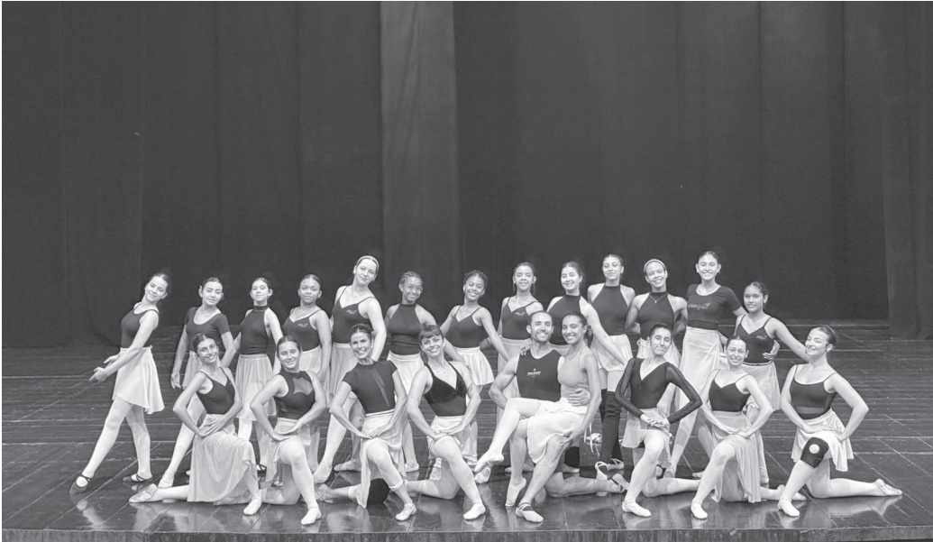
Elenco com 115 integrantes entra na reta final de preparação para a estreia do espetáculo

Clássico do Ballet de Repertório ganha nova leitura em espetáculo natalino nos dias 22 e 23 de novembro