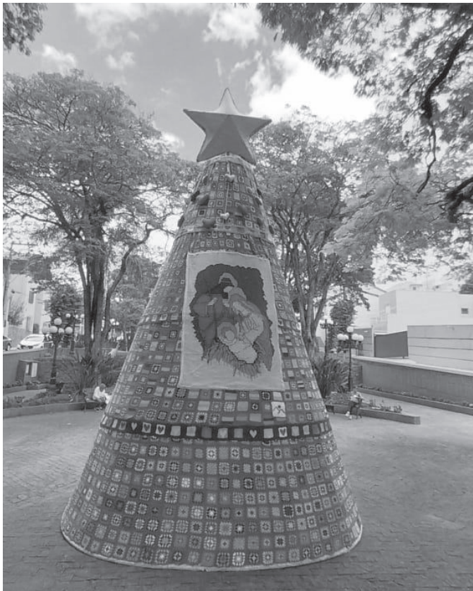
Projeto simboliza a união entre Poder Público, voluntariado e comunidade, celebrando o Natal com sensibilidade e propósito

O Grupo Quadrinhos de Amor, responsável pela confecção artesanal da árvore, reuniu voluntárias que trabalharam na produção dos módulos de crochê e tricô ao longo do ano: “Cada peça representa o engajamento e o sentimento de partilha