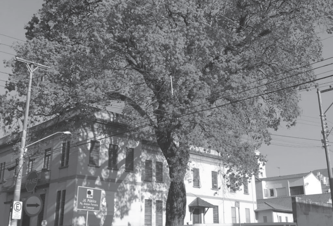
Escola das Artes, em Amparo, é um dos locais escolhidos como Ponto MIS para exibição dos filmes

10ª Mostra de Cinema Chinês – “O Amor de Mumu” Data: Quinta-feira, 27 de novembro Horário: 18h30 Local: Escola das Artes Endereço: Rua Luiz Leite, 232, Centro - Amparo-SP Entrada gratuita