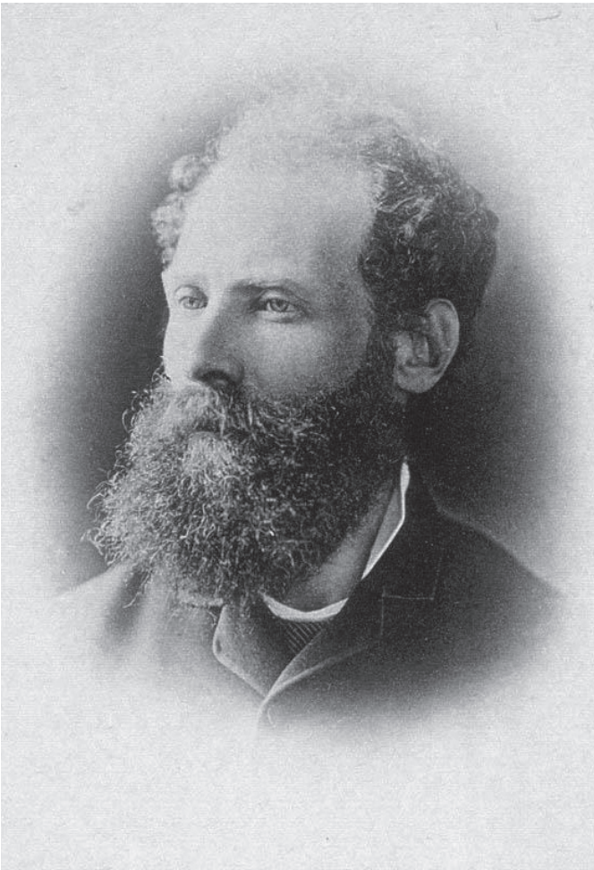
O poeta e ensaísta português Antero de Quental, fotografado por volta de 1887

Nesta semana, a recomendação do Jornal O Serrano para os seus leitores é esta: leiam Antero de Quental. Apreciem a simplicidade e a beleza de seus versos – às vezes tristes, filosóficos, às vezes suaves e bucólicos, mas nunca superficiais.