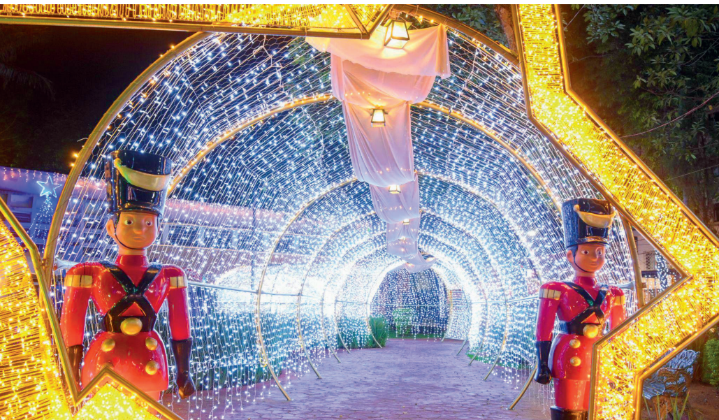
Ruas e praças de Serra Negra recebem a tradicional iluminação de Natal | Prefeitura de Serra Negra

Com quase 2 milhões de luzes e atrações gratuitas, programação natalina começa nesta sexta-feira (14)