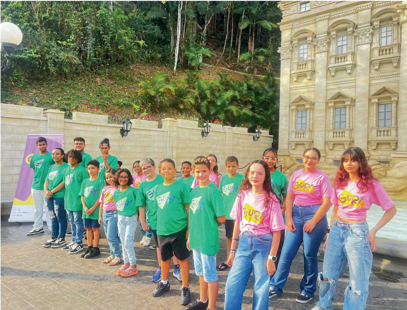
Guri é o maior programa de educação musical e desenvolvimento humano do Brasil | Projeto Guri Serra Negra

A rede de polos abertos passa a ser organizada em quatro modalidades: Polos Harmonia - Oferece todos os cursos de instrumentos do programa, incluindo o de Iniciação Musical voltados a diferentes faixas etárias e formações; Polos Polifonia - Cursos específicos de instrumentos a partir das demandas de cada território e da formação instrumental e/ou vocal do Grupo Musical mantido pelo programa nessas localidades. Também oferece cursos de Iniciação Musical voltados a diferentes faixas etárias e formações; Polos Acordes - Polos de ensino em municípios próximos onde há os Polos Harmonia e Polifonia para complementar a formação oferecida em cada território e conectar estudantes de diferentes ci-