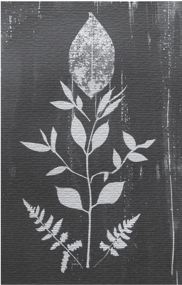
Cianotipia com folhas coletadas em Serra Negra (2025)

Você pergunta a minha idade, eu te mostro a eternidade e te conto que eu sou infinita.