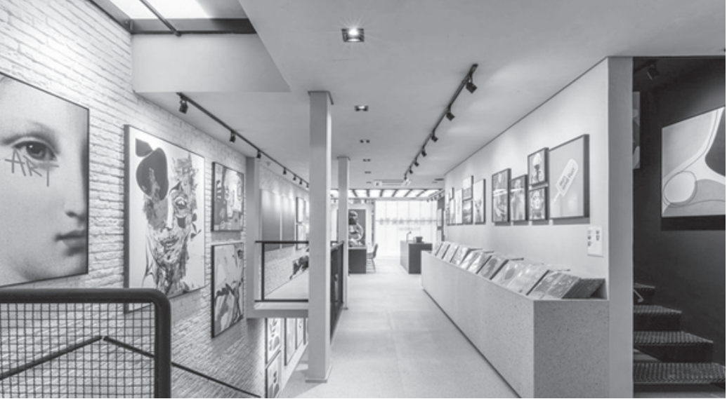
Arte urbana é utilizada para decorar espaços de casa, escritórios e consultórios

Mostra reúne obras de artistas brasileiros e estrangeiros e segue aberta ao público até 31 de janeiro