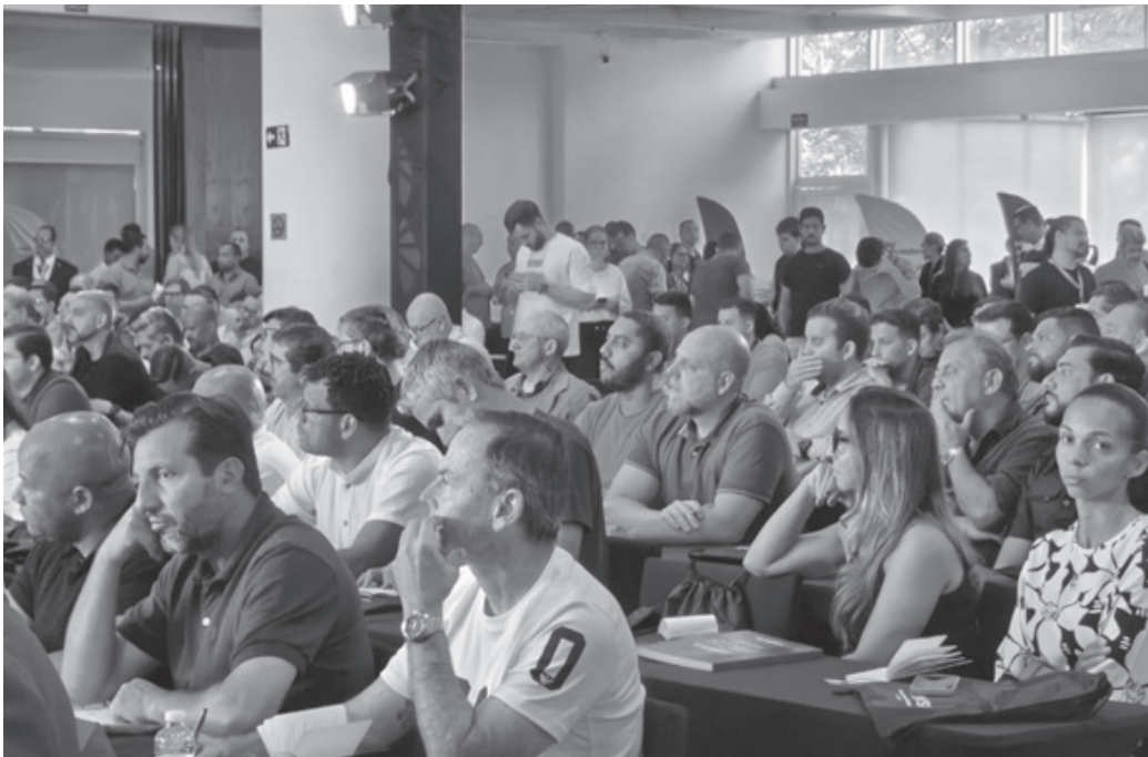
Evento contou com a presença de secretários de todo o Estado | Prefeitura de Monte Alegre do Sul

“Nosso objetivo é trabalhar de forma integrada com outras cidades e entidades para construir políticas públicas mais eficientes, que contribuam para o desenvolvimento esportivo e o bem-estar da população”, informou, por meio de nota enviada à imprensa, o departamento de Esportes e Lazer de Monte Alegre do Sul, que esteve presente no encontro. O fórum encerrou-se com a proposta de criação de grupos de trabalho permanentes, responsáveis por acompanhar as ações discutidas e promover a cooperação contínua entre os municípios, visando o fortalecimento e a sustentabilidade das políticas públicas de esporte e lazer em todo o Estado de São Paulo.