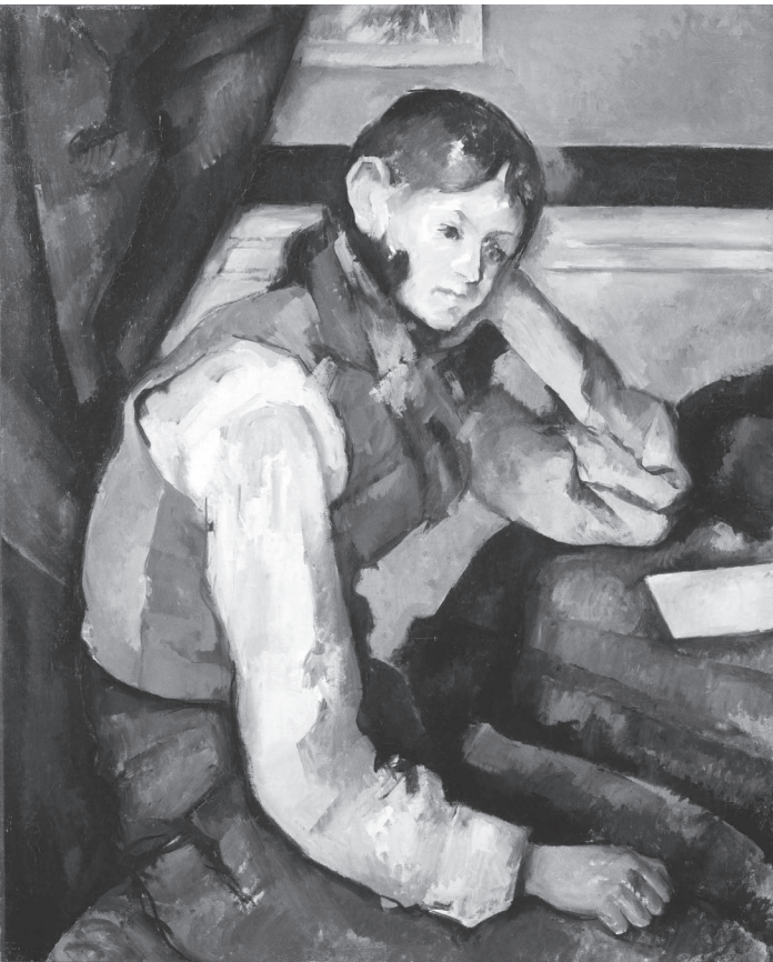
O Menino do Colete Vermelho, de Paul Cézanne (Pintado entre 1888-1890)