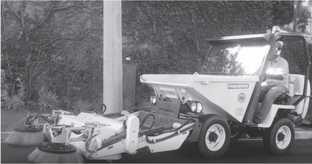
Máquina é utilizada para proceder a limpeza das áreas urbanas e de extensão urbana nos bairros

Aumento do número de ruas pavimentadas levou à aquisição do equipamento