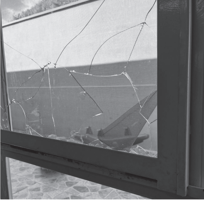
Vidro de janela de sala de aula de crianças de dois anos de idade foi quebrado

As denúncias anônimas podem ser feitas pelo telefone (19) 3892-9630. Em caso de flagrante a orientação é de que seja acionada imediatamente a Guarda Civil Municipal (GCM) pelo telefone 153.