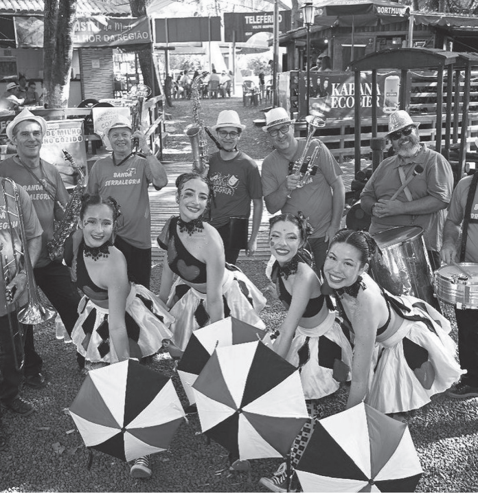
Carnaval 2026 acontece entre os dias 14 e 17 de fevereiro | Prefeitura de Serra Negra

cípio. “O Serra Alegria 2026 promete mais uma edição marcada pela alegria, criatividade e pela participação ativa da comunidade e dos visitantes, consolidando Serra Negra como destino de destaque durante o período carnavalesco”, informa a prefeitura.