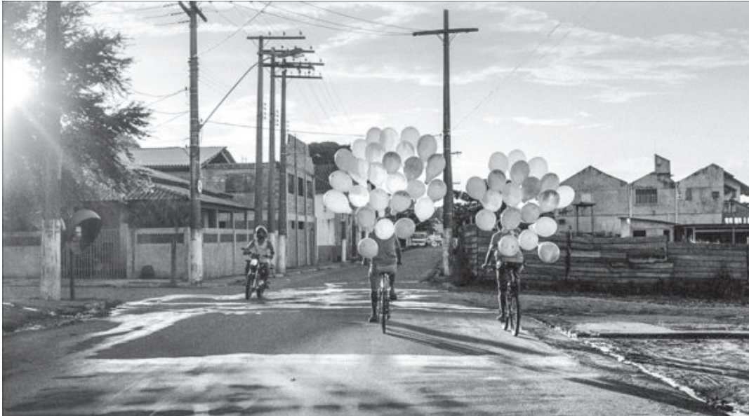
Olhares sobre o Brasil: fotógrafo francês Xavier Roy é o destaque da programação cultural em Socorro

Foco da mostra é apresentar visão de fotógrafo estrangeiro sobre as paisagens e o cotidiano do Brasil