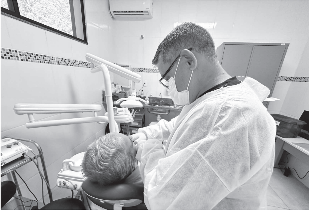
Mais de 600 próteses foram entregues ao longo do ano passado

Mais de 3 mil entregas foram realizadas nos últimos cinco anos