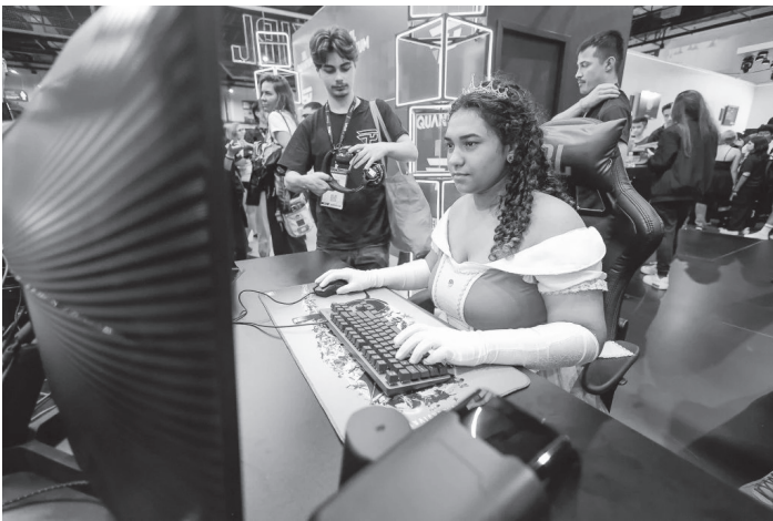
Jogos, campeonato de cosplay, palestras com especialistas e com influenciadores e shows musicais fazem parte da programação