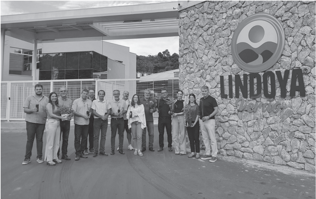
Representantes dos municípios participaram da entrega de mudas na sede da engarrafadora

Primeira etapa do programa contempla as cidades de Serra Negra, Lindóia, Águas de Lindóia e Pedreira