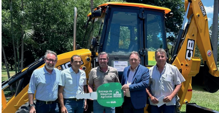
Entrega da retroescavadeira viabilizada por recurso federal reforça a infraestrutura municipal e o atendimento ao setor rural | Prefeitura de Serra Negra