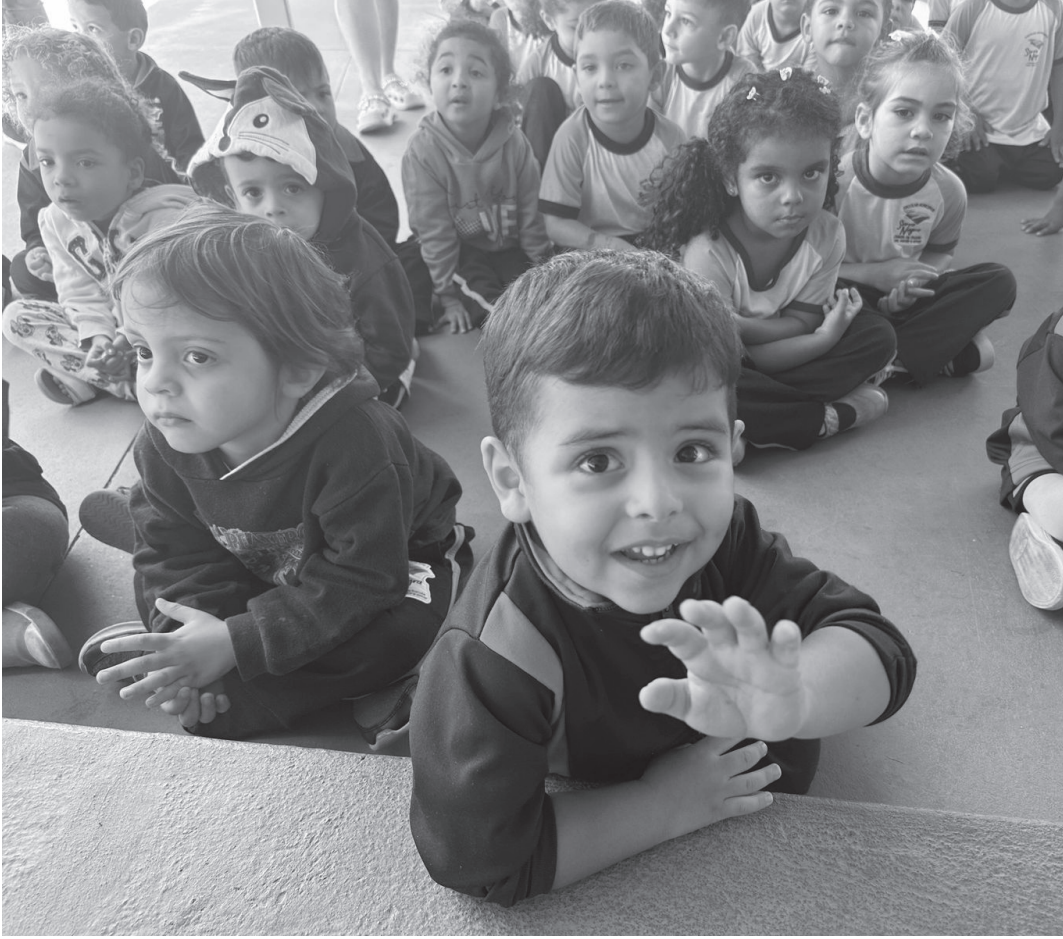
Ensino Apostilado, projetos extraclasse, alimentação de qualidade e apoio psicológico são algumas das ferramentas que garantem o sucesso da educação serrana