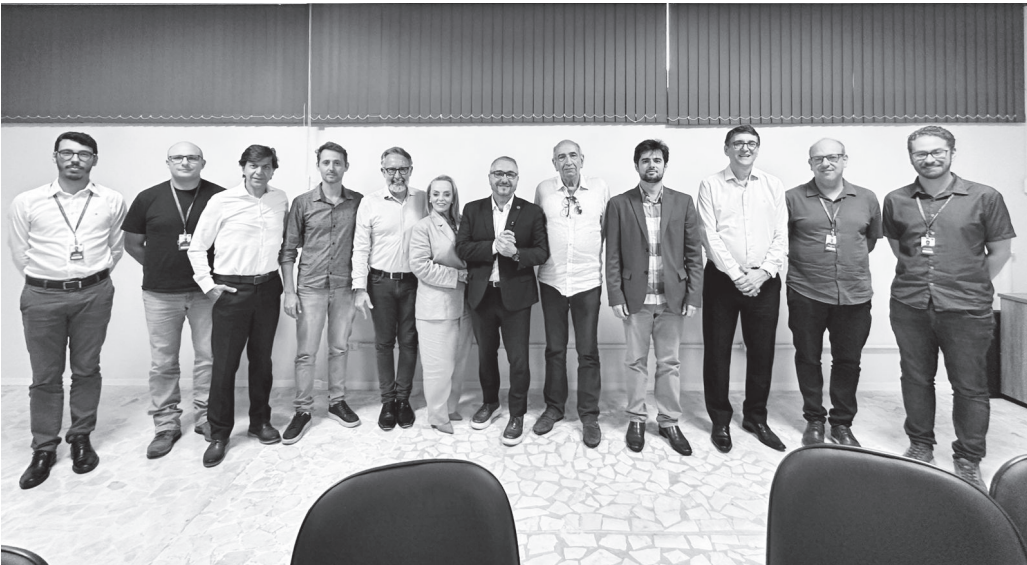
Encontro visa fortalecer a economia e fomenta empreendedorismo serrano

Encontro tratou do fomento ao empreendedorismo local e à participação de empresários serranos nos processos de licitação