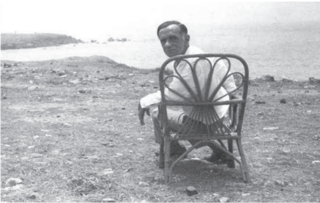
João Cabral de Melo Neto (1920–1999), poeta pernambucano e um dos maiores nomes da literatura brasileira do século XX

Celebrar o aniversário de João Cabral de Melo Neto é lembrar que sua poesia continua a ensinar, não pelo excesso, mas pela precisão; não pela emoção fácil, mas pela força silenciosa da palavra exata.