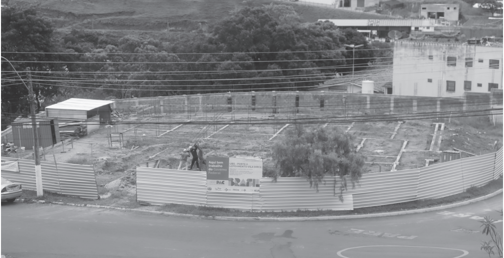
Posto de Saúde vereador Celso Bueno Corsetti na Vila Dirce passa por processo de ampliação e reforma | Prefeitura de Serra Negra

São investidos mais de 2 milhões de reais na edificação da unidade de saúde