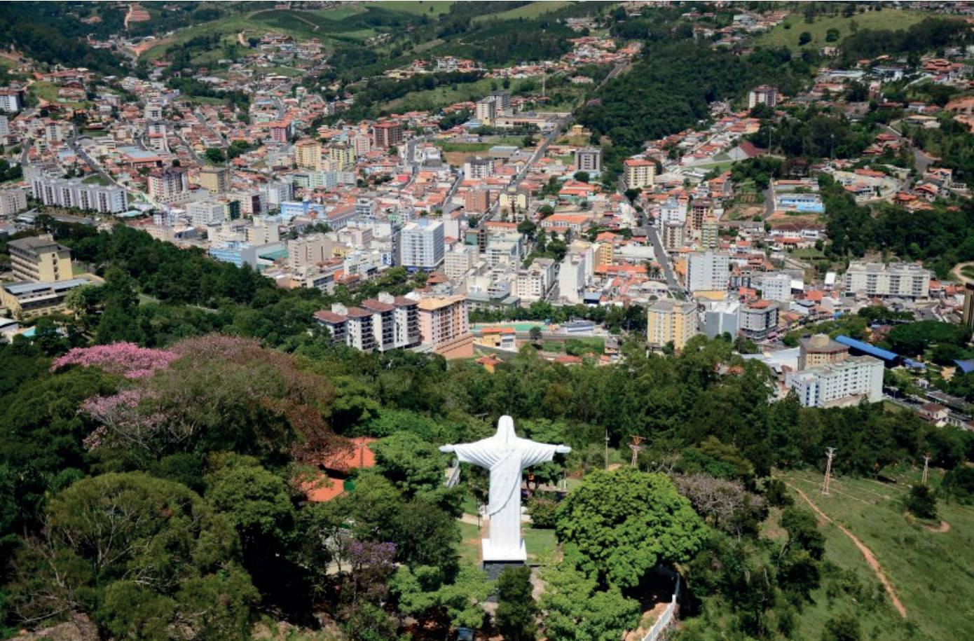
Moradores de Serra Negra são convidados a participar da Pesquisa de Percepção do Turismo, iniciativa que avalia os impactos da atividade turística no município

Questionário online ficará disponível até 31 de janeiro e busca medir impactos econômicos, ambientais e socioculturais da atividade turística no município