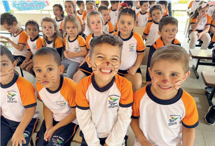
Secretaria da Educação afirma que ações integradas resultaram no aumento dos números no âmbito da educação pública serrana | Prefeitura de Serra Negra