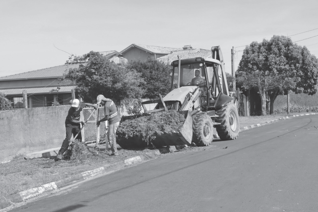
Restos de móveis, galhos de árvores, latas, pneus e garrafas são coletados por equipes da Secretaria de Serviços Municipais

Serviço contribui para a limpeza dos bairros e a prevenção de focos do mosquito da dengue