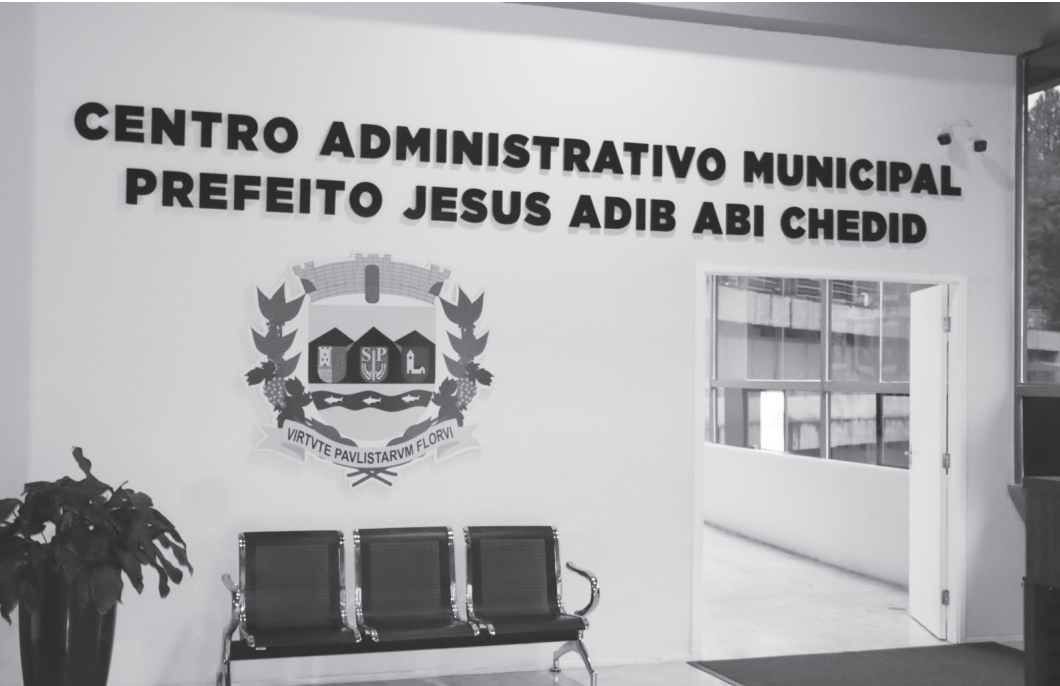
Município pode adquirir carros e outros itens para a saúde pública | Prefeitura de Serra Negra

modernos para a saúde pública, especialmente aqueles utilizados no atendimento ambulatorial. Agora seguimos trabalhando para que tudo isso se concretize e amplie ainda mais o atendimento à nossa população”, destacou o prefeito. A prefeitura informou ainda que segue acompanhando as próximas etapas do processo, “com o objetivo de garantir que os recursos se transformem em benefícios concretos para os moradores de Serra Negra, especialmente na área da saúde e no atendimento à população”.