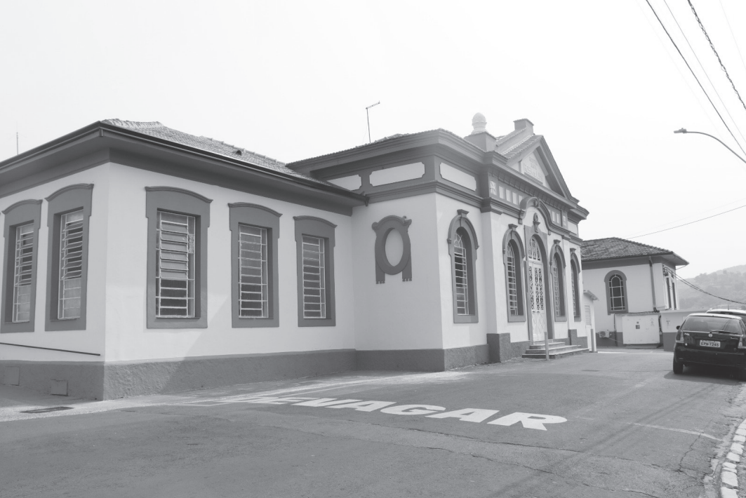
HSRL foi eleito para a realização de cirurgias em moradores de Serra Negra e região

Em nota, a Secretaria Municipal de Saúde afirmou que a iniciativa “reforça o papel de Serra Negra como referência regional em saúde, amplia o acesso da população a procedimentos cirúrgicos e contribui diretamente para a redução das filas de espera no sistema público”.