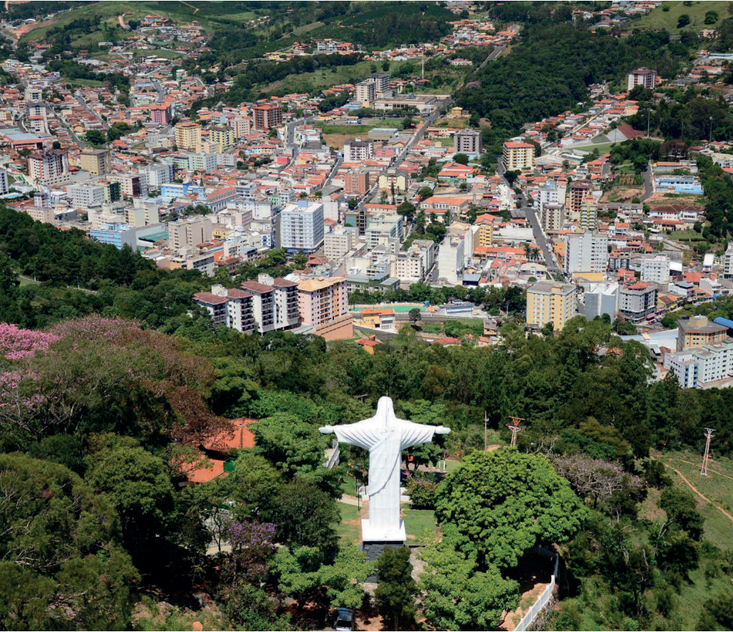
Moradores de Serra Negra podem participar da Pesquisa de Percepção do Turismo e contribuir com a avaliação dos impactos da atividade turística no município