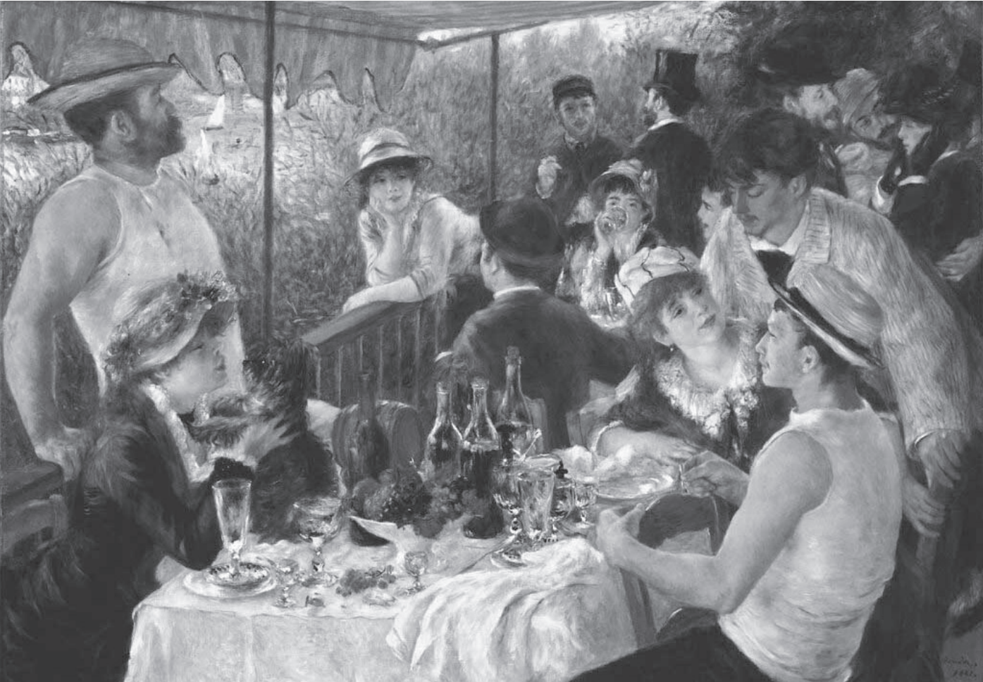
Luncheon of the Boating Party, Pierre Auguste Renoir (1880)

Entre a ilusão do recomeço e a permanência do que somos