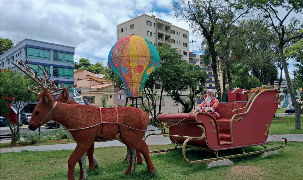
Trenó do Papai Noel e balão gigante enfeitam a Praça Sesquicentenário | Ibraim Gustavo Santos

Decisão da Prefeitura atende pedidos de comerciantes e moradores, mantendo os enfeites nas vias e praças públicas por mais alguns dias