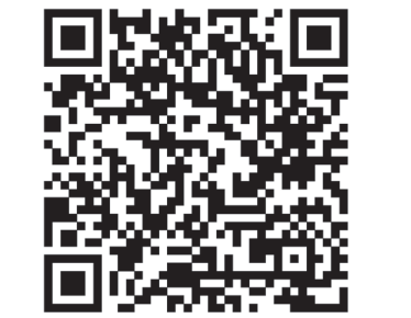
Documentário ‘O sorriso indígena e a renascença’ mostra a transformação na vida de indígenas do Pará e da Bahia por meio da saúde bucal | Giancarlo Giannelli

No ano passado, Giannelli lançou o livro Amazônia - Rio Tapajós , fruto da Expedição Barco da Saúde, de 2017, realizado também em parceria com a Faculdade São Leopoldo Mandic, de Campinas-SP, que levava atendimentos médicos e odontológicos a comunidades indígenas e ribeirinhas que vivem no Amazonas. O jornal O Serrano conversou com o jornalista e fotógrafo na ocasião do lançamento da obra, e a entrevista está disponível no canal O Serrano Conversa, no Spotify. O documentário “O sorriso indígena e a renascença” está disponível gratuitamente no YouTube, no canal oficial de Giancarlo Giannelli, ampliando o acesso do público a uma história que une jornalismo, pesquisa acadêmica e transformação social. Para assistir ao vídeo de 18 minutos, basta apontar a câmera do celular para o QR Code abaixo: