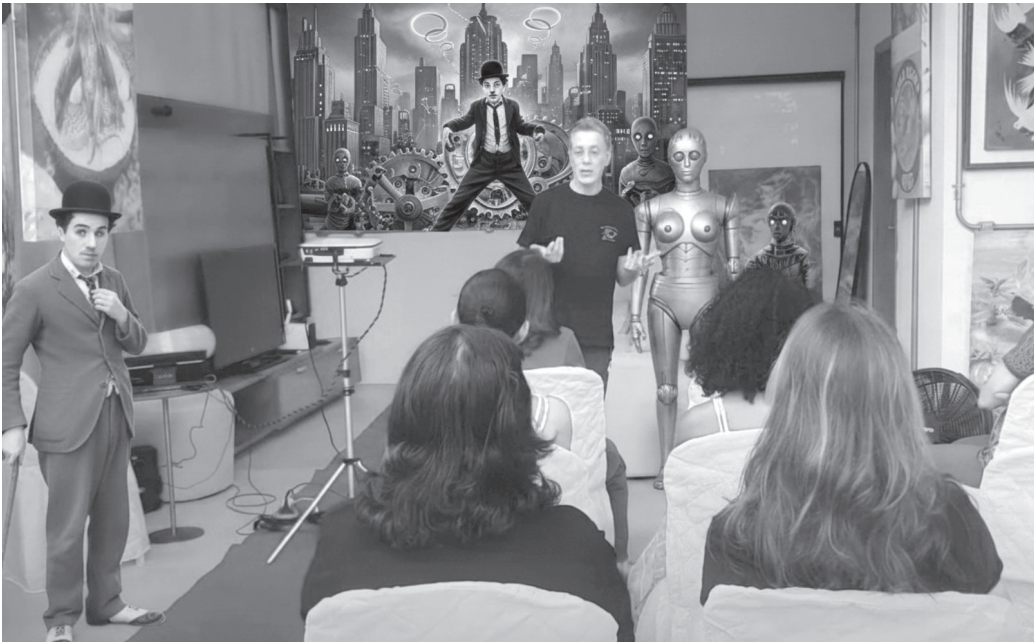
Tempos Modernos em Metrópolis | Ilustração: Henrique Vieira Filho

Você sabia que ao lado da Fontana de Trevi havia um cinema? Mas, calma! Antes que você me pergunte: "Na Fontana daqui ou na da Itália?", eu respondo: Nas duas! Pois é! A história adora uma rima poética. Tanto na Cidade Eterna quanto na nossa "Cidade das Águas", os cinemas vizinhos às fontes não resistiram à concorrência das grandes redes e fecharam as portas.