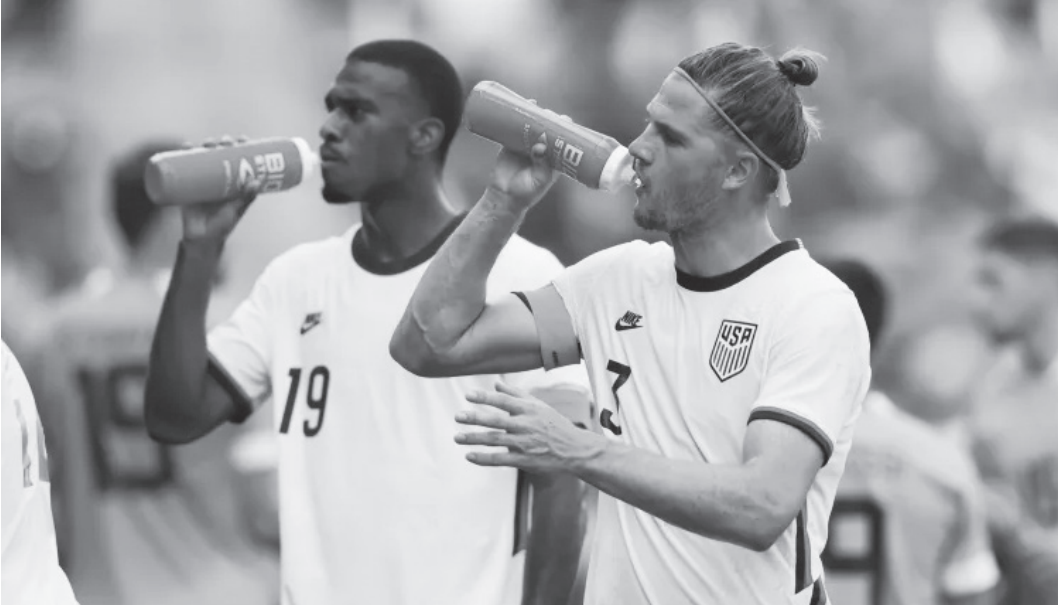
Paradas de hidratação passam a integrar oficialmente o regulamento e devem alterar o ritmo das partidas no próximo Mundial

Medida inédita padroniza protocolos de bem-estar e reduz riscos físicos em meio ao calendário intenso e às variações climáticas do torneio