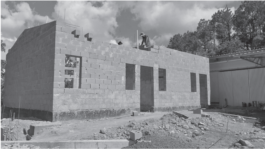
No Bairro Nova Serra Negra, servidores atuam no levantamento das estruturas físicas da unidade escolar

Reestruturação das unidades de ensino visam garantir maior segurança e conforto para os estudantes