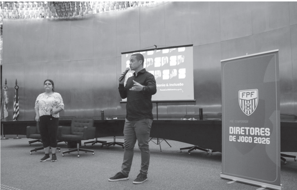
Governo de São Paulo promoveu evento de capacitação para a inclusão | Governo de São Paulo

Os participantes também receberam informações sobre as diferentes barreiras que dificultam o acesso e a participação de PcD em espaços públicos. Elas podem ser físicas, comunicacionais, tecnológicas, pedagógicas e atitudinais, estas últimas relacionadas a posturas e decisões humanas. A formação incluiu ainda estratégias de combate ao capacitismo, forma de discriminação contra pessoas com deficiência.