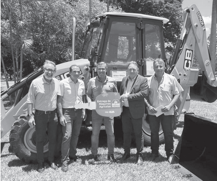
Prefeitura afirma que a nova máquina contribuirá com a manutenção de estradas e no apoio aos produtores rurais | Prefeitura de Serra Negra

A Prefeitura informou ainda que recebeu um computador e uma impressora por meio de emenda parlamentar do deputado federal Celso Russomanno, destinados ao Programa de Proteção e Defesa do Consumidor (Procon) do município. Os equipamentos foram incorporados ao patrimônio público municipal e passam a integrar a estrutura do órgão, contribuindo para a melhoria do atendimento à população.