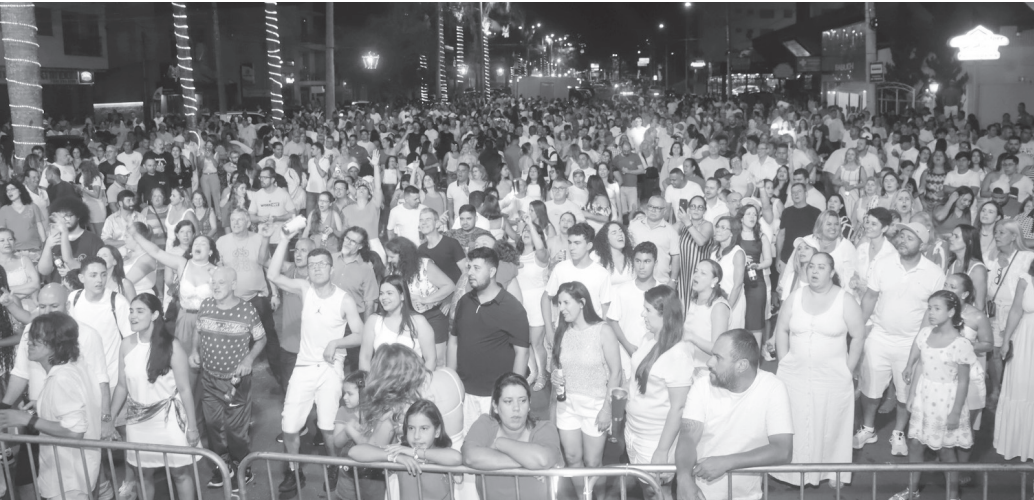
Público lota a Avenida Laudo Natel para assistir ao Show da Virada e à contagem regressiva no Réveillon | Prefeitura de Serra Negra

Festival de Verão tem música, dança e recreação gratuitas para todas as idades