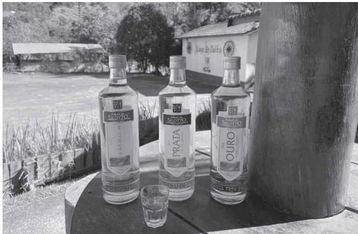
Alambique Família Silotto em Serra Negra faz parte da Rota da Cachaça do Estado de São Paulo

Para o presidente da InvestSP, Rui Gomes, a agência atua de forma articulada com o Governo do Estado, os municípios e o setor produtivo, conectando políticas públicas, investimentos e vocações locais: “Esse trabalho reforça nosso papel como parceiros estratégicos dos municípios, contribuindo para a construção de territórios mais competitivos, conectados e preparados para um desenvolvimento sustentável”, comentou.