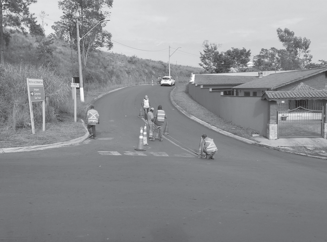
Rua Benedito Magalhães recebe nova pintura de faixas e sinalização de trânsito | Prefeitura de Serra Negra

Ligando a Estrada do Bairro da Serra à do Barroco de Cima, a Estrada Municipal Renato Briotto Marchi recebeu manutenção com máquinas e caminhões carregados de cascalho. O trecho não pavimentado da Rua Paulo Marchi, acesso ao Alto da Serra, passou por manutenção com o uso de motoniveladora e caminhão com cascalho. Já nas ruas Hermínio Demattê, no Jardim Gustavo, Antônio Spinhardi e José Alves de Godoy Filho, na Vila Dirce, foram realizados serviços de capinação, roçagem e limpeza. Por fim, servidores atuaram na manutenção da Estrada Municipal Egisto Fruchi, com apoio de uma motoniveladora, enquanto no canteiro central da Avenida Juca Preto, no bairro das Palmeiras, equipes realizaram a roçagem do grama-