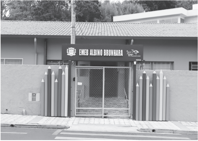
EMEB Albino Brunhara é uma das escolas que continuam abertas para receber as crianças que participam do projeto Creche-polo