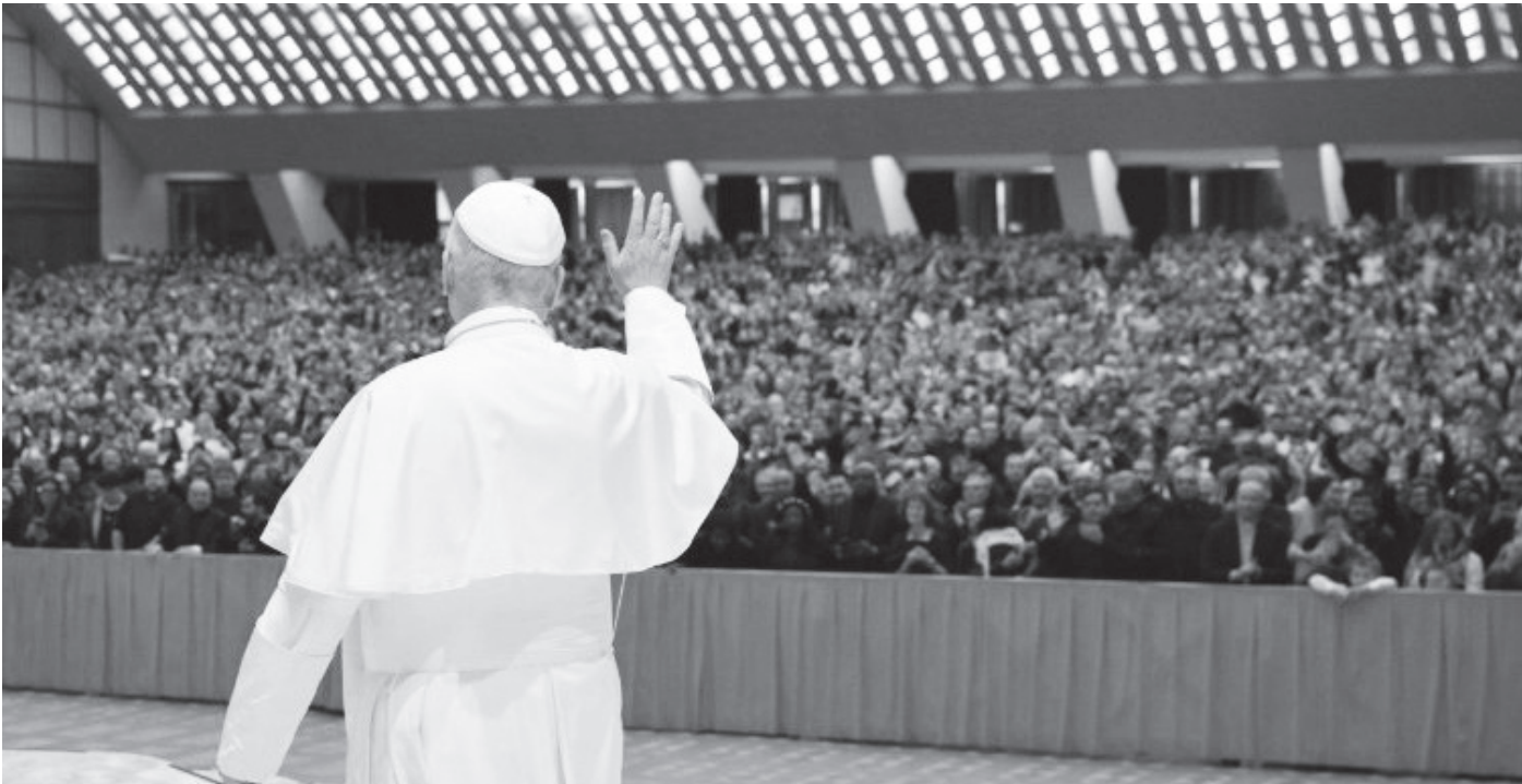
“Tudo o que somos e possuímos, pede para ser oferecido a Jesus”, declarou o Sumo Pontífice

Mensagem ressalta o exemplo dos Magos, o apelo do Jubileu à partilha e a construção de uma paz fundada na equidade e na comunhão