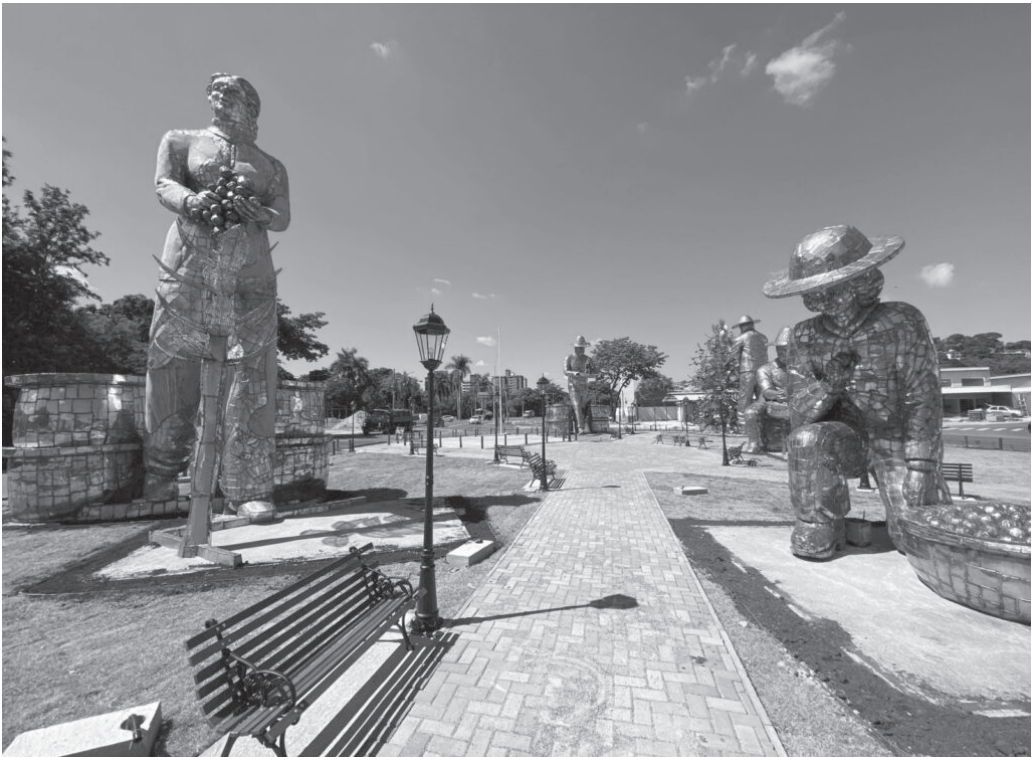
Esculturas têm entre 8 e 12 metros de altura e representam imigrantes italianos trabalhando na lavoura de café

Além da Rotatória do Café, em 2025 Amparo inaugurou a primeira das rotatórias em homenagem à fundação do município. Localizado no entroncamento das avenidas Bernardino de Campos, Fioravante Gerbi e Sebastião Gonçalves da Cruz, o dispositivo traz a imagem de Nossa Senhora do Amparo. Ainda como parte do levantamento histórico do município, Amparo deve ganhar mais dois pontos turísticos: um em homenagem aos primeiros imigrantes e outro dedicado ao cavalo Mangalarga.