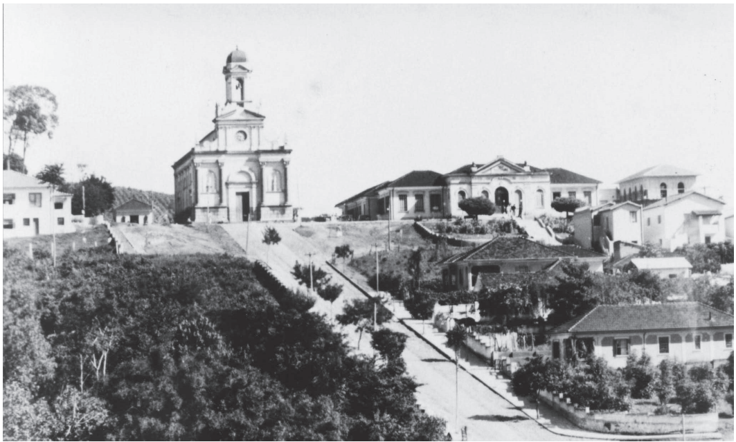
No alto do morro, a Igreja de São Benedito, palco de uma das mais antigas e tradicionais celebrações religiosas da história serrana

Amanhece o dia 6 de janeiro, do vigésimo sexto ano do terceiro milênio. Nesta data, a Igreja Católica comemora a Epifania, ou seja, a chegada dos Reis Magos para reverenciarem o nascimento do Menino Jesus. Aqui em Serra Negra, além dessas comemorações, por décadas, devotos de São Benedito celebraram grandes festas em honra a Santa Efigênia e a São Benedito, na igreja do alto do morro, duas das festas religiosas mais antigas da história serrana.